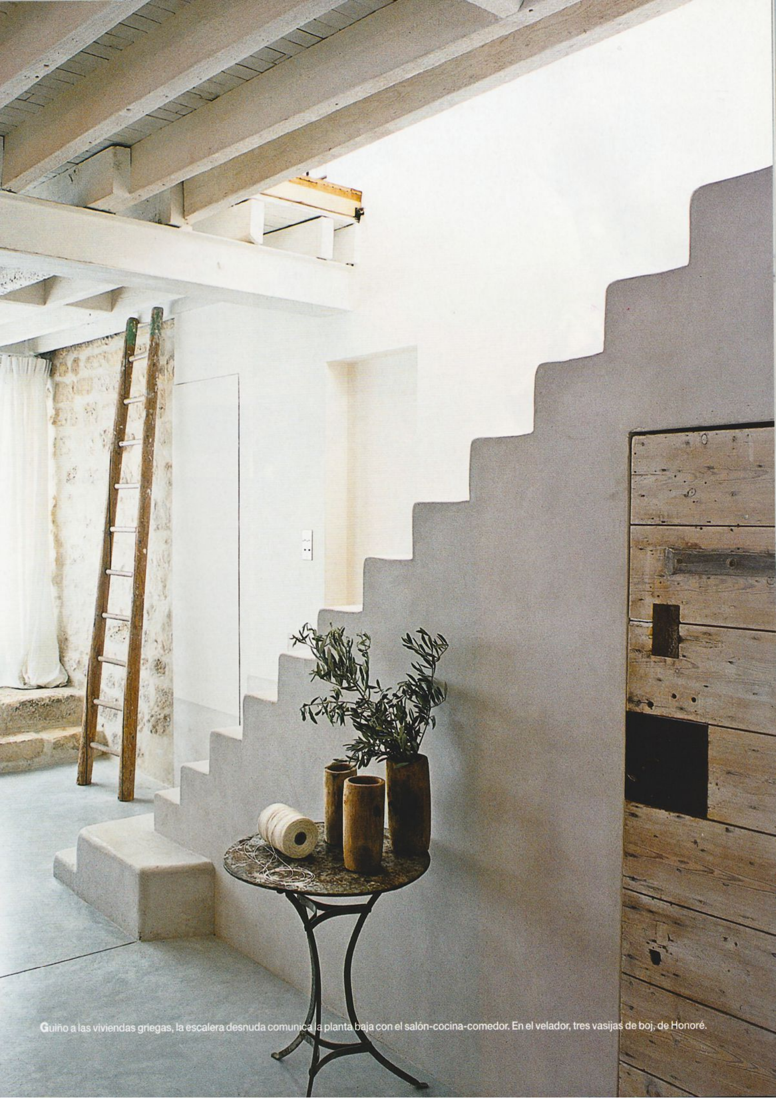
Guiño a las viviendas griegas, la escalera desnuda comunica la planta baja con el salón-cocina-comedor. En el velador, tres vasijas de boj, de Honoré.